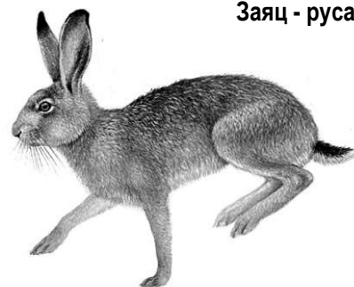
Заяц - русак

«ВЕЧЕРНИЙ ПЕТЕРБУРГ» от 27 марта 2008 года