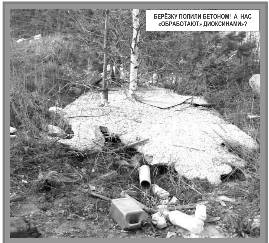
БЕРЕЗКУ ПОЛИЛИ БЕТОНОМ! А НАС «ОБРАБОТАЮТ» ДИОКСИНАМИ?