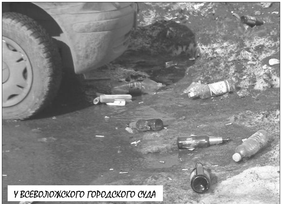
У ВСЕВОЛОЖСКОГО ГОРОДСКОГО СУДА